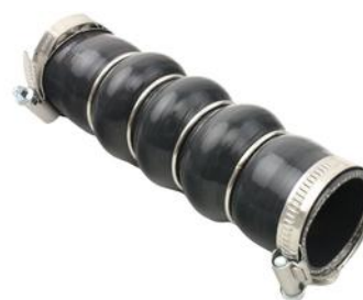
RURA TURBINY CITROEN BERLINGO 08> 14> 1.6 BlueHDI