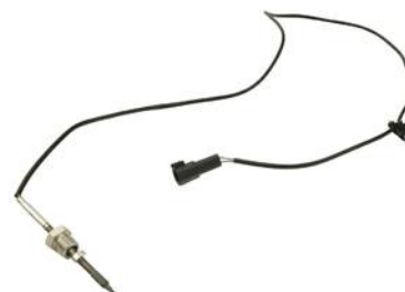
CZUJNIK TEMP SPALIN FORD TRANSIT 06> FILTR DPF 2.2 TDCI 13>