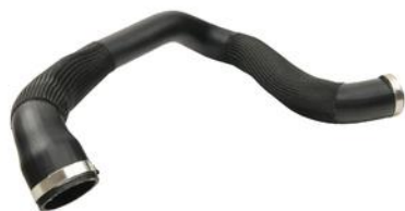
RURA INTERCOOLERA CITROEN JUMPY 16> WYLOT 2.0 BLUEHDI