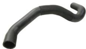
RURA CHŁODZENIA MERCEDES CITAN 12> 1.5CDI