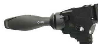
PRZEŁĄCZNIK ZESPOLONY FORD TRANSIT COURIER 14> KIERUNKOWSKAZ