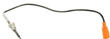
CZUJNIK TEMP SPALIN VW CRAFTER 06> FILTR DPF 2.0 TDI 11>