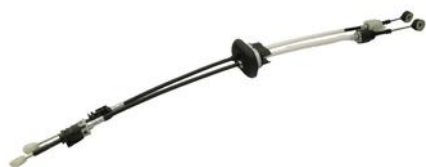
LINKA ZMIANY BIEGÓW CITROEN JUMPY 07> KPL 965/717 + 965/700 MM